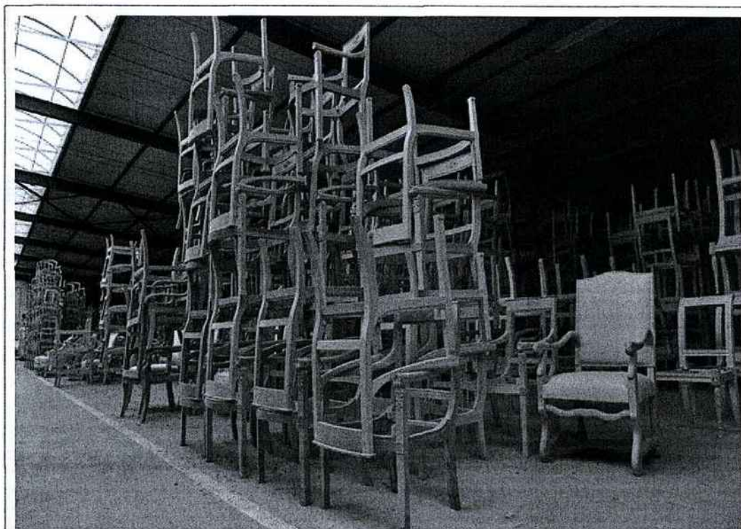
Néo Sièges produit des carcasses brutes de sièges de style, également appelées « fûts ».