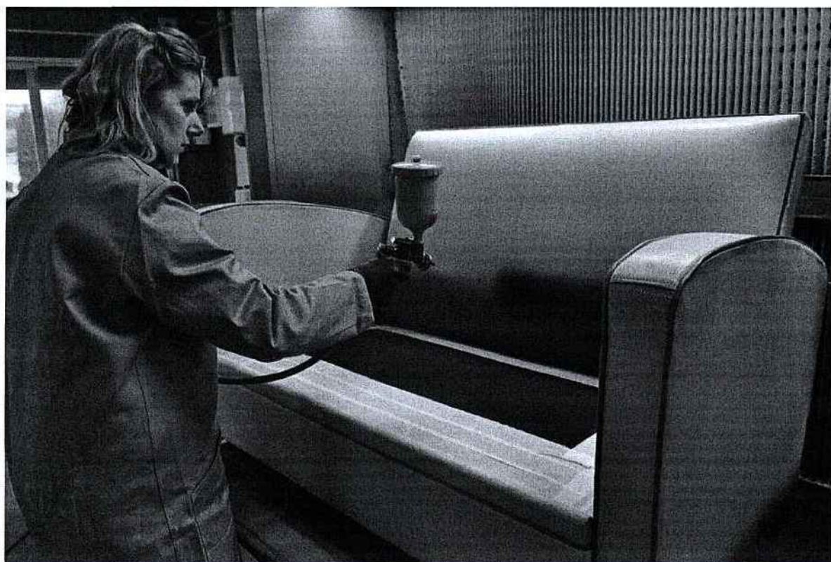
L'atelier de fabrication de fauteuils Club vendus exclusivement en ligne.